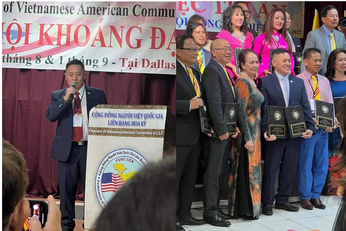
Hội viên trong Cộng Đồng nhà xin chúc mừng hai vị Tân Nhiệm này.